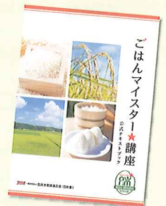
公式テキストブック (A4版 100頁)

申込方法 右のQRコードからwebでお申し込みください。 申込締切日は、各会場開催日の1か月前までです。